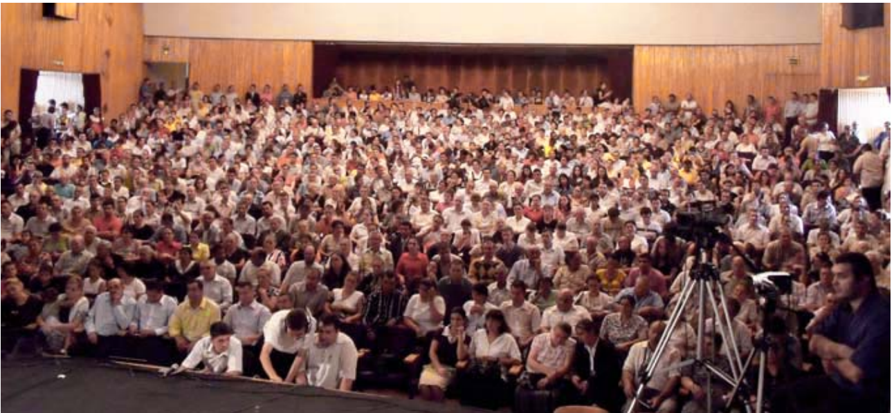
Una riunione del 23 agosto 2009 in Romania. Alcune migliaia di veri credenti biblici del Messaggio del tempo della fine erano radunati per udire la vera Parola ed essere benedetti.