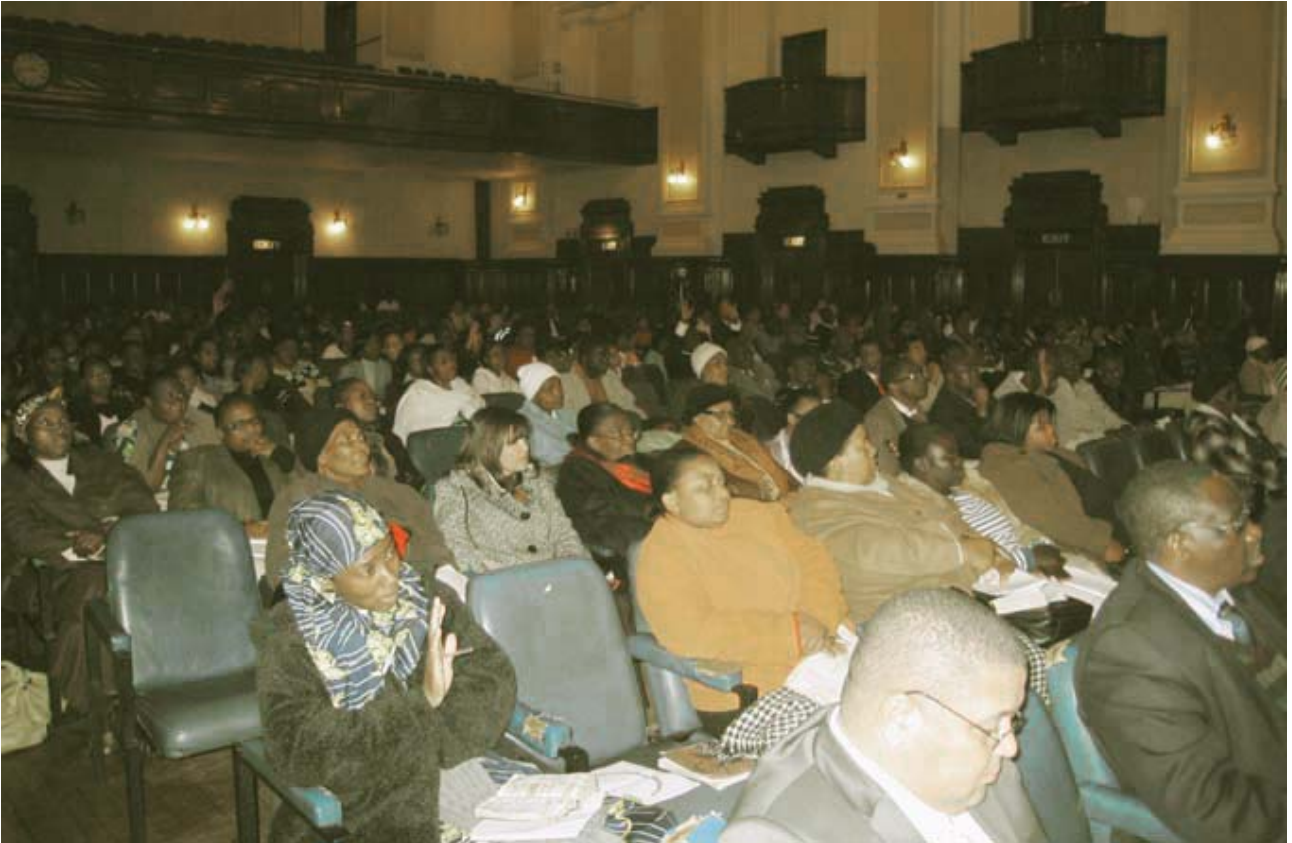
Riunione a Johannesburg il 17 agosto 2009

"... così è della mia parola, uscita dalla mia bocca: essa non torna a me a vuoto, senz'aver compiuto quello ch'io voglio, e menato a buon fine ciò per cui l'ho mandata" (Is. 55:11).