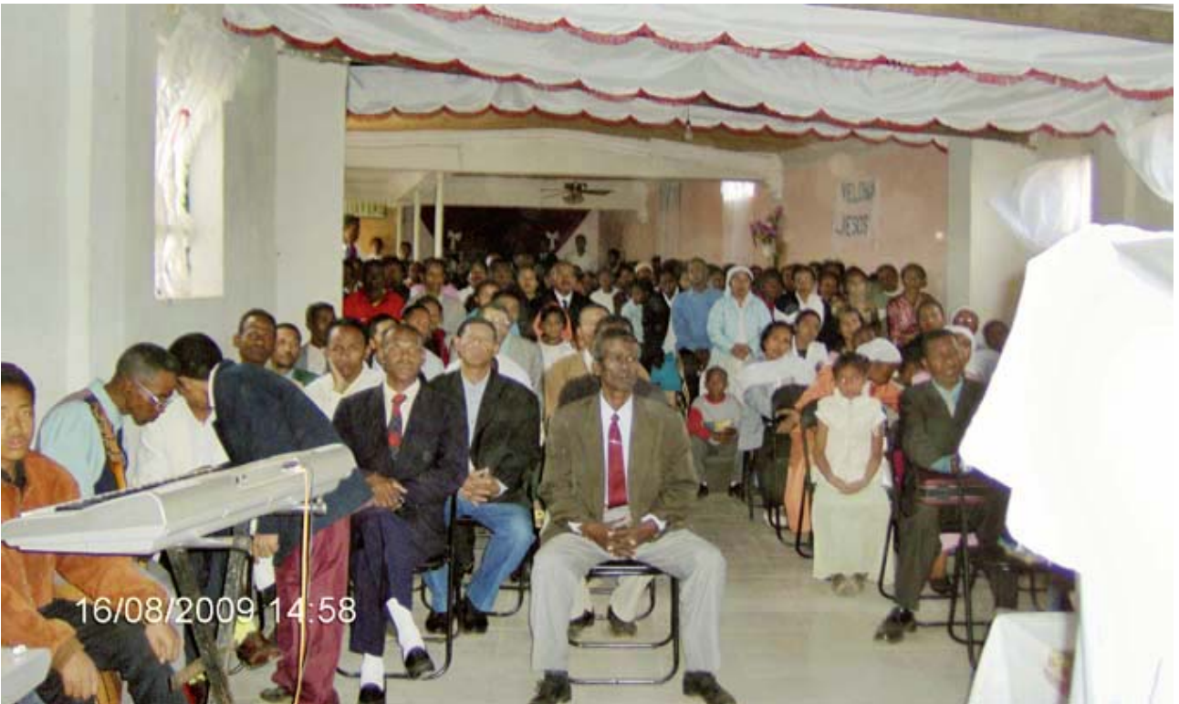
Riunione a Madagascar il 16 agosto 2009